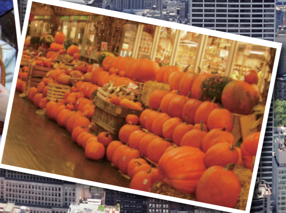
※掲載写真はすべてイメージです

【視察企画】 一般社団法人 大阪外食産業協会 〒556-0012 大阪市浪速区敷津東2-2-8 大阪木津地方卸売市場 南棟2階 TEL.06-7668-5575 / FAX.06-7668-1075